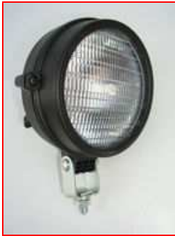
Obj.č. 100 0052